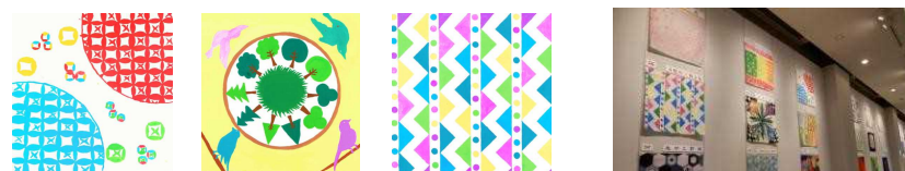
「和」 「森の中の小鳥」 「4色の三角と丸」