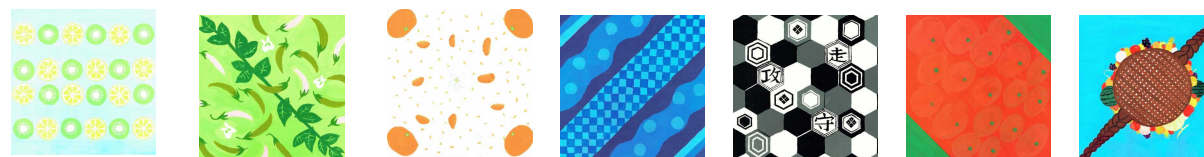
「キウイとレモン」 「SUNNAPPUエンドウ」 「ミカン」 「海の中」 「亀甲と野球」 「とまと」 「青空の下で果物を」